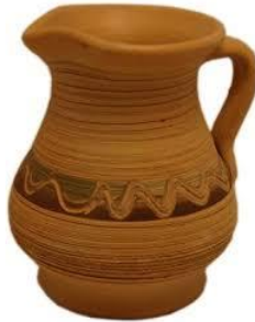
jarro de barro