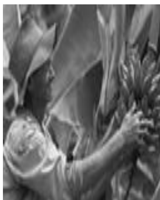
# PRIMEIRO EMPREGO

Em Campinas, uma turma de amigos já embriagados, foram buscar a última pessoa e ir para balada, parou em frente da casa da jovem chamou, e junto com a moça veio a mãe. A mãe com medo vendo todos embriagados e sua filha entrando naquele carro lotado, pegou na mão da filha que já estava dentro do carro e disse: "FILHA VAI COM DEUS QUE ELE LHE PROTEJA", a filha pra tirar uma onda com a mãe disse: "SÓ SE ELE FOR NO PORTA-MALAS, POIS AQUI JÁ ESTÁ LOTADO". A polícia técnica disse que pela violência do acidente seria impossível o porta-malas ficar intacto, quando o policial abriu o porta-malas, lá estava uma bandeja com 18 ovos sem nenhum arranhão, e todos nos lugares corretos na bandeja.