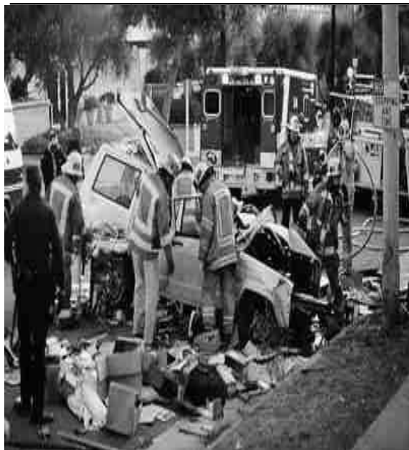
# IMPRUDÊNCIA NO TRÂNSITO

9- Observe os exemplos que se seguem. Analisando a mensagem que expressam verifique se este representa um aspecto positivo ou negativo da modernidade.