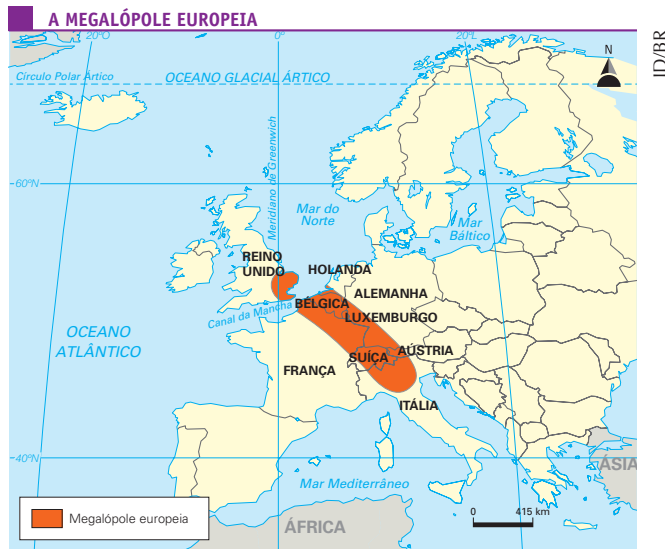
Fonte: Géographie. L'espace mondial . Term. L, ES, S. Paris: Belin, 2004. p. 161.

7 Com o auxílio do mapa, responda às questões: