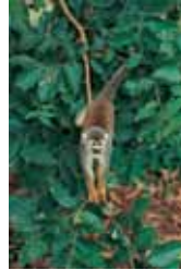
José Vicente Resino Ramos/ Archivo SM/ID/ES