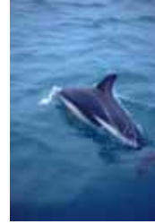
John Foxx Images/ID/ES