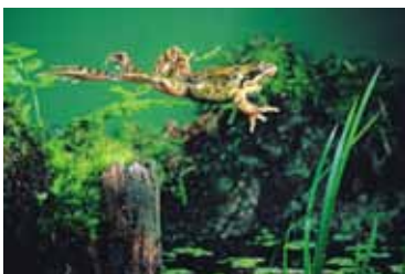
John Foxx Images/ID/ES